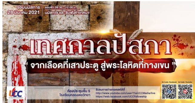
ภาพที่ 2 ภาพการถ่ายทอดความรู้เกี่ยวกับบียู (อิสราเอล) ของคริสตจักรแห่งพระบัญญัติ